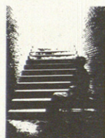
LOS MINUSVALIDOS y las Barreras Arquitectónicas